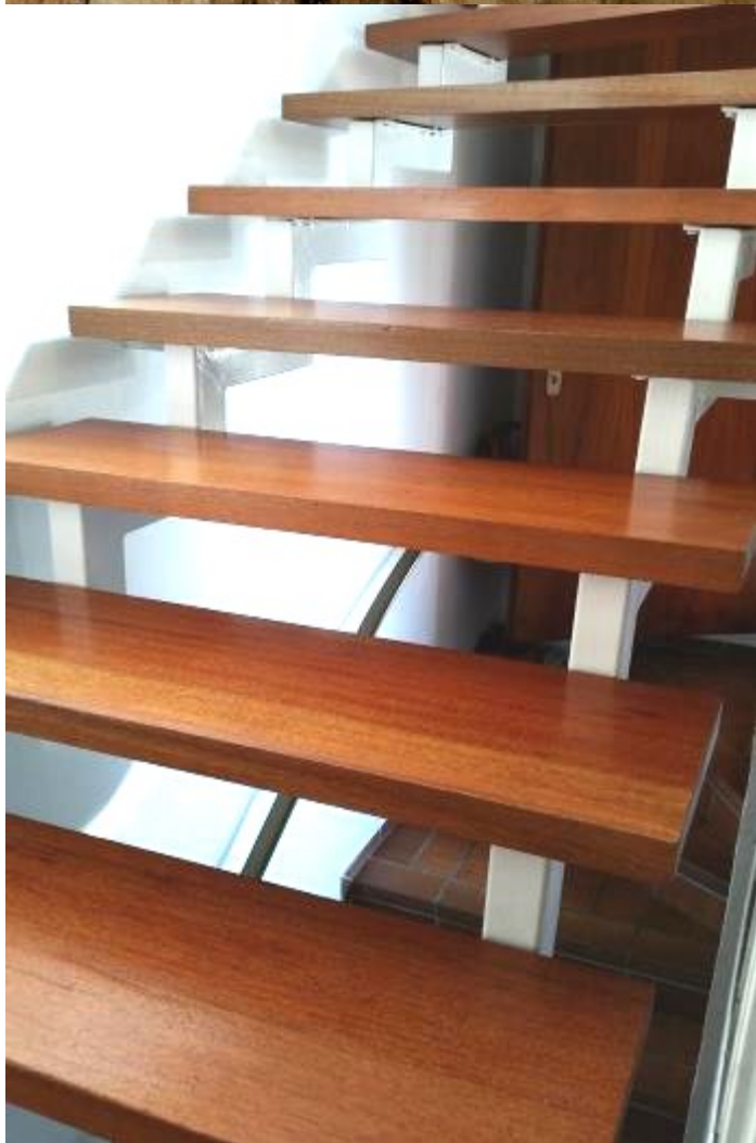
Nahaufnahme von STOP it auf geriffeltem Holz