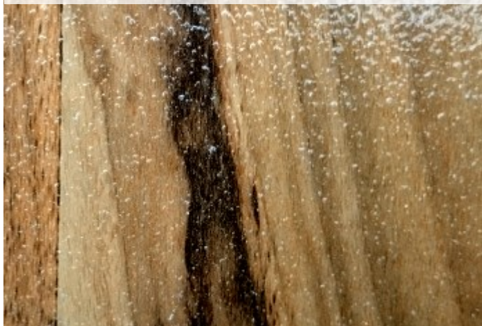
Nahaufnahme von STOP it auf Laminat

Holz ist ein stark saugendes Material. Damit auch im Außenbereich, wie z.B. auf einer Holzterrasse eine langlebige Haftung von STOP it Anti-Rutsch garantiert werden kann, wird vorab eine Haftgrundierung aufgetragen. Dadurch wird eine atmungsaktive Feuchtigkeitssperre erzielt, die verhindert, dass aufsteigende Feuchtigkeit zwischen das Holz und STOP it Anti-Rutsch gelangt.